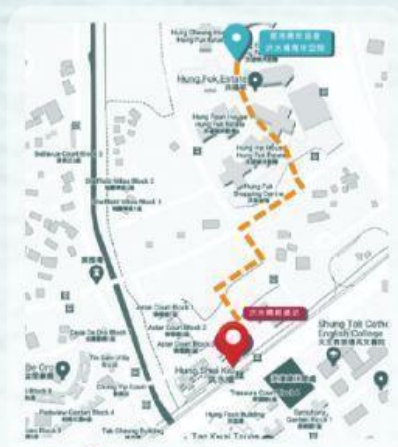
洪水橋洪福邨洪溢樓地下

電話 Tel : (852) 2448 7474 傳真 Fax : (852) 2447 8758 電郵 Email : hsk@hkfyg.org.hk 網站 Website : hsk.hkfyg.org.hk Facebook : facebook.com/hkfyghskfp